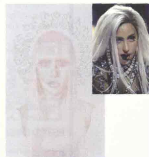
In queste pagine le opere degli artisti di Artipicità , omaggio alla bellezza di dieci donne icone del nostro tempo.