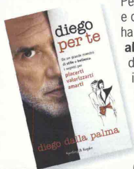
La copertina del libro firmato da Diego Dalla Palma, edito da Sperling and Kupfer. Diego per te , pp. 376, € 18,50